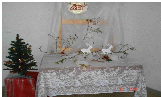
Chantal ROUSSEAU Cyrille PETIT